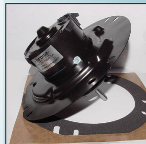
Unidad original del fabricante

13-00 E450; E550 camoinetas comerciales de uso semipesado.